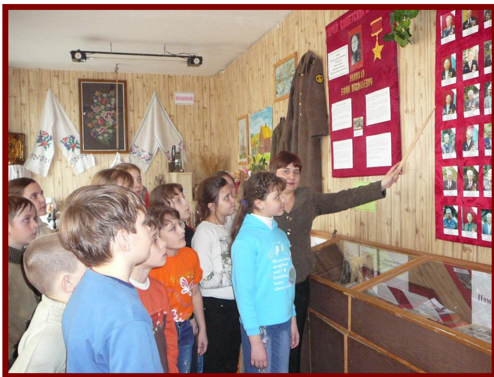
Можно прослушать интересный лекционный материал.